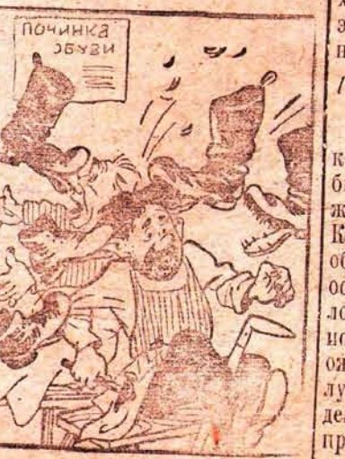
— За то, что плохо чинили!