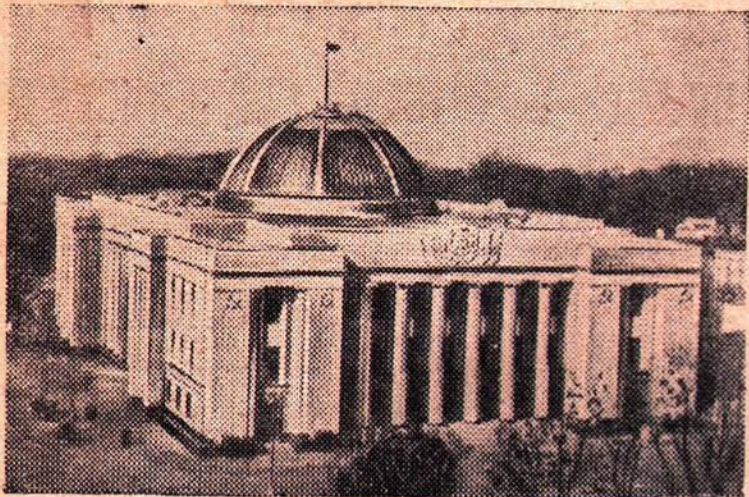
КИЕВ. Восстановленное здание заседаний Верховного Совета Украинской ССР.