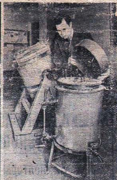
Трехлетним планом развития колхозного и совхозного продуктивного животноводства (1949—1951 г.г.) предусмотрена широкая механизация трудоемких работ на фермах.

зав. отделом партийных профсоюзных и комсомольских органов АК ВКП(б).