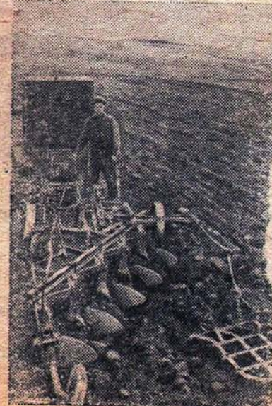
ВИННИЦКАЯ ОБЛАСТЬ. В колхозе имени Ленина, Литянского района.

Хозяйскую заботу об урожае будущего года проявляют колхозники артели им. Сталина. План подъема паров сталинцы выполнили на 136 проц. Сейчас они двойт пары. Всего в колхозе поднято 515 гектаров паров, из которых вдвоено 243 га.