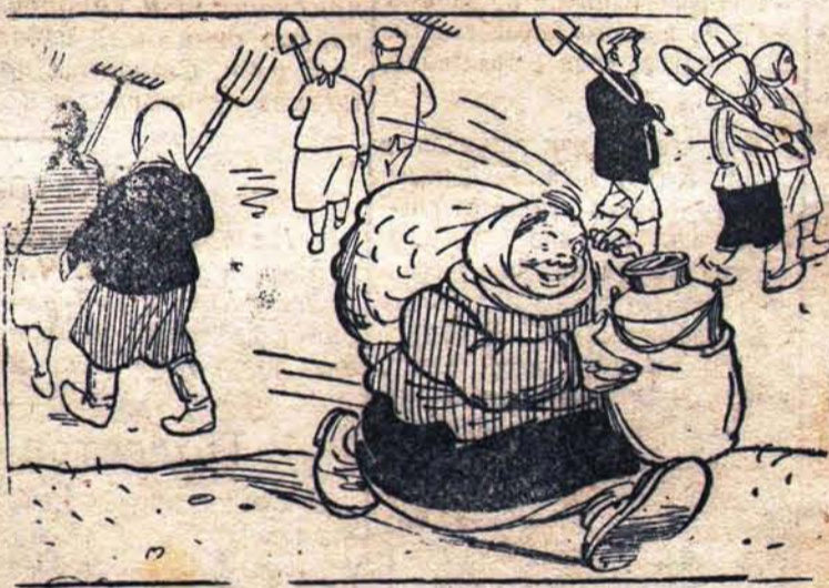
— Кто куда, а я на рынок!..