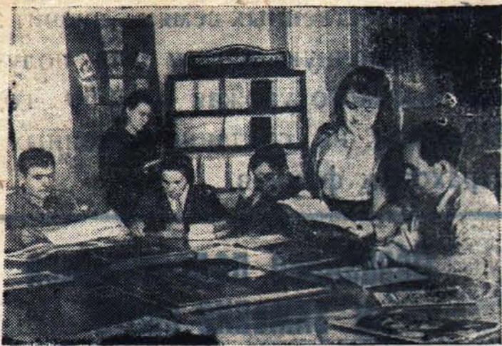
Львовская область. Соколовский районный партийный кабинет хорошо подготовился к началу партийной учебы. В помощь изучающим историю ВКП(б) подобрана литература и наглядные пособия. Кабинет имеет достаточное количество книг на украинском языке, в том числе краткий курс истории ВКП(б), сочинения Ленина и Сталина.