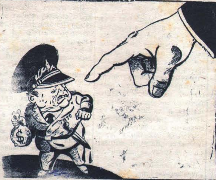
Скажи-ка, гадина, сколько тебе даденц?!