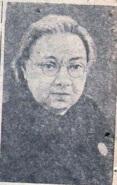
диума Верховного Совета СССР. В 1939 году 27 февраля оборвалась жизнь этого выдающегося борца за дело рабочего класса и всех трудящихся, борца за коммунизм.

После февральской революции 1917 года Крупская вместе с В. И. Лениным возвратилась в Россию и под руководством Владимира Ильича принимала активное участие в борьбе за власть Советов, в подготовке к Октябрьской социалистической революции. После Октябрьской революции Надежда Константиновна была назначена членом коллегии Наркомпроса, затем заместителем Наркома, с 1927 года избиралась членом ЦК ВКП(б), была членом Прези-