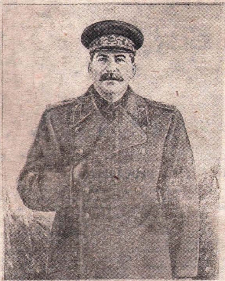
СЛАВА ВЕЛИКОМУ СТАЛИНУ

Советские люди знают, что пока существует империализм, остается опасность нападения на нашу Родину. Вот почему священным долгом каждого со- ветского патриота является за- бота о постоянном укреплении вооруженных сил социалисти- ческого отечества.