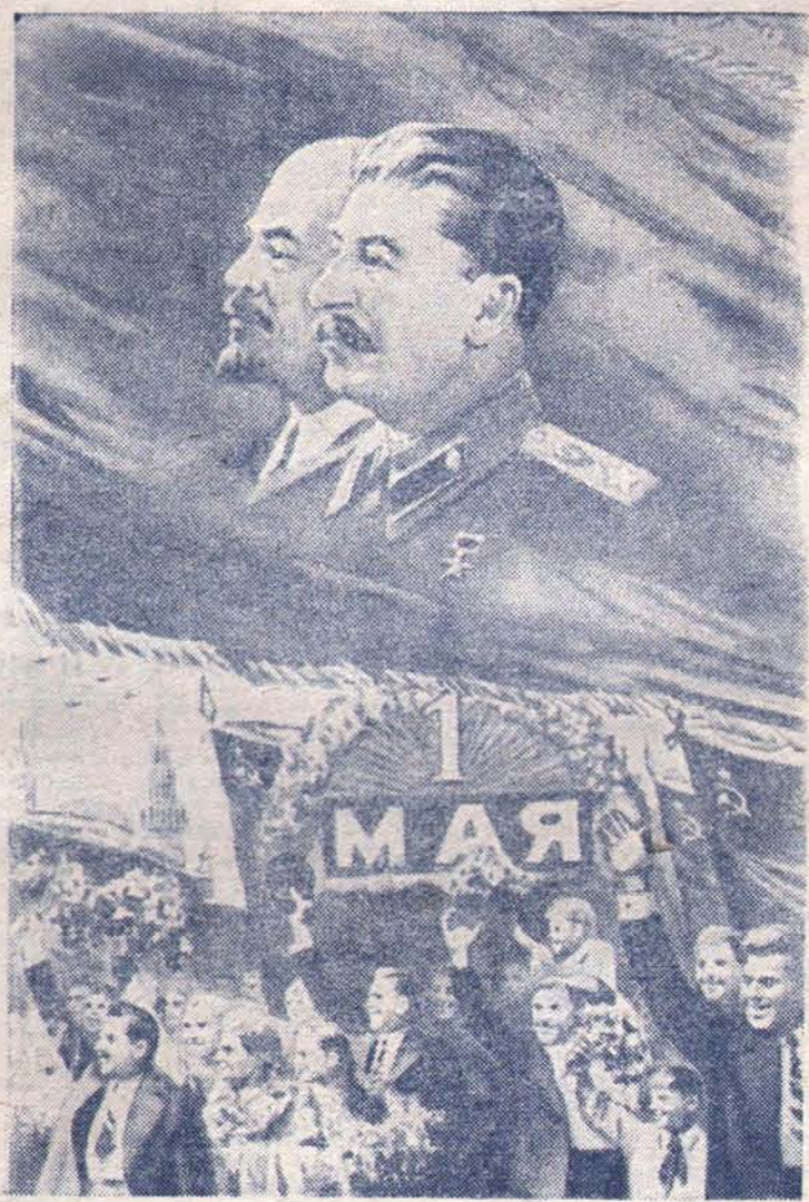
Рис. Н. Павлова.

День смотра боевых сил трудящихся всего мира