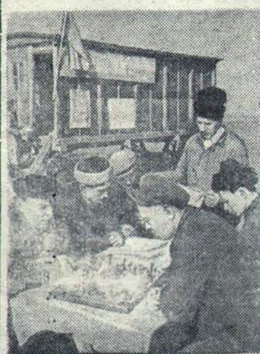
МОЛДАВСКАЯ ССР. К началу весенних полевых работ правление колхоза имени Молотова Слободзейского района оборудовало полевой вагончик для тракторной бригады № 9 Слободзейской МТС. В нем имеются шапки, шахматы, радиоприемник, более 200 книг художественной литературы.

На днях колхоз приступит к ремонту сенокосилок и конных граблей. Ручной инвентарь имеется. В. Тарасов.