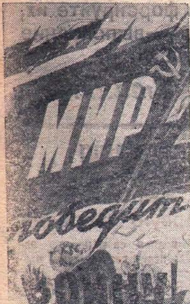
Плакат работы художника К. Иванова выпущенный Государственным издательством „Искусство“.

Неисчислимы бедствия припасет немецкому народу замышляемый американскими стратегами взрыв скалы Лорелей. В ре-