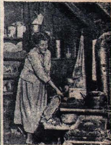
Американский образ жизни означает беспощадную эксплуатацию рабочих, безработицу, голод и нищету широких масс трудящихся. Многие американские рабочие живут в исключительно тяжелых условиях. Низкий заработок, систематическое недоплатение, скудность способствуют распространению эпидемий.