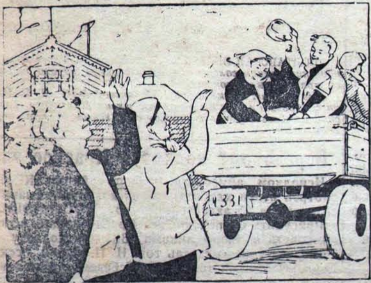
— Желаем вам зимой учиться так же хорошо, как вы летом работали на полях!