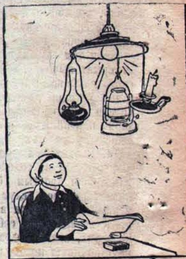
Электrolампа и запасные части к ней...