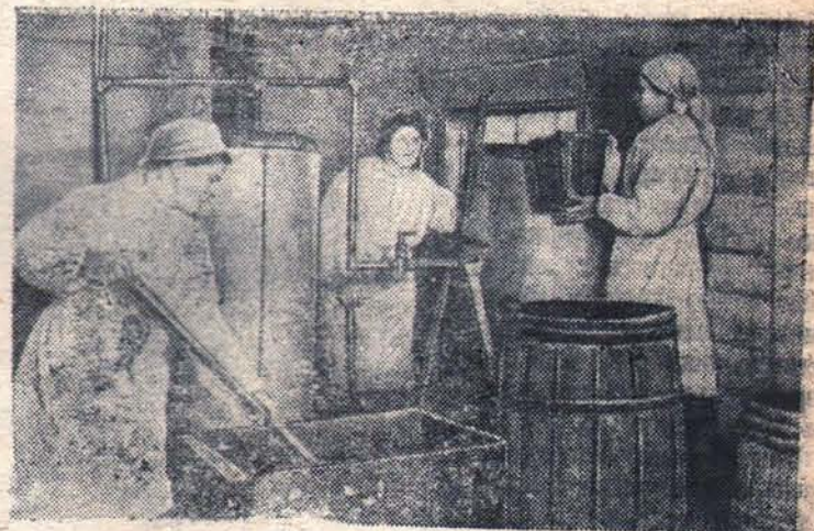
КРАСНОЯРСКИЙ КРАЙ. На свиноводческой ферме колхоза имени В. М. Молотова Шушенского района к началу нынешнего года насчитывалось 443 свиноматки—более 150 процентов плана. Ферма славится хорошо поставленным уходом за поголовьем. Многие трудовые процессы там механизированы и, в частности, механизирована подготовка кормов.

На поля вывезено всего лишь 1600 возов навоза или 17 проц. к доведенному заданию. План по сбору золы и птичьего помета выполняется также не-удовлетворительно.