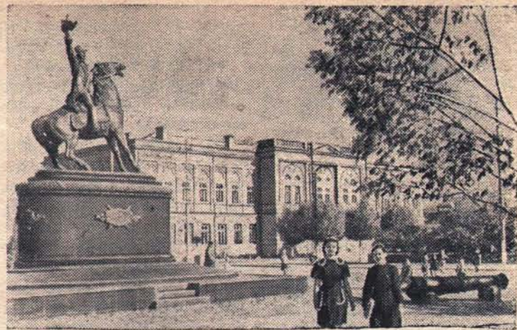
ИЗМАИЛ. Памятник Александру Васильевичу Суворову на проспекте Суворова.