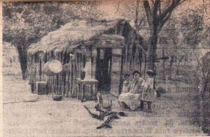
Аргентина. Хижина индейцев в районе Тартагал (провинция Сальто).