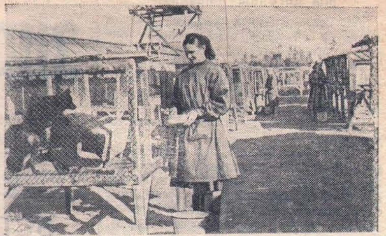
Омская область. Муромцевский зверопитомник — один из самых крупных в Сибири. Здесь разводят серебристо-черных лисиц. Сейчас в клетках и вольерах его выращивается 2000 зверьков. В этом году работники питомника получили по 4—5 щенков от одной лисы.

Вся организаторская деятельность партийных организаций колхозов должна быть направлена сейчас на решительное усиление массово-политической работы.