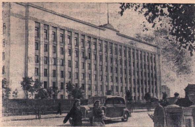
МИНСК. Здание Центрального Комитета Коммунистической партии Белоруссии.