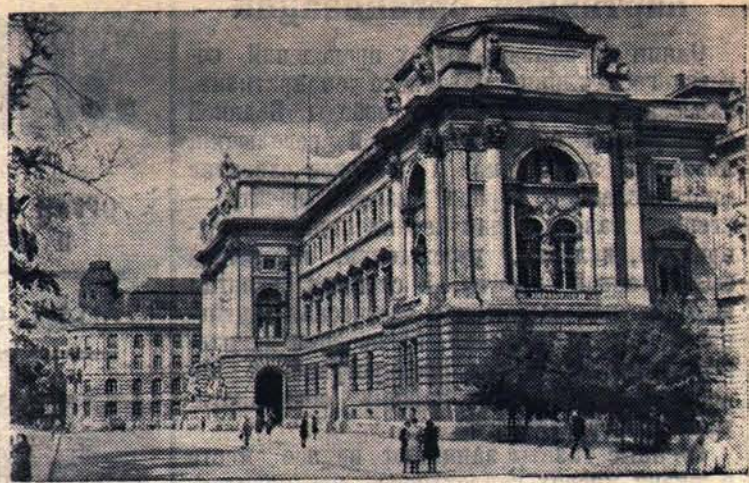
г. Львов. Львовский университет имени Ивана Франко.

Сейчас, идя навстречу 40-й годовщине Великого Октября, комсомольские организации должны еще выше поднять социалистическое соревнование, воспитательную и культурно-массовую работу. Можно быть уверенным, что при должном внимании со стороны руководителей и партийных организаций предприятий и строкам, молодежь успешно справится с этой почетной и большой задачей.