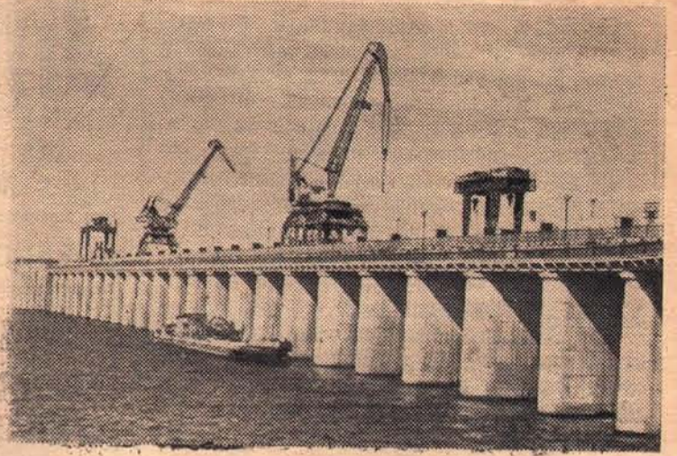
Новая Каховка. Плотина Каховского гидроузла.