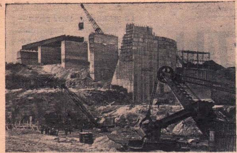
На строительстве Кременчугской ГЭС. Коллектив строителей Кременчугского гидроузла взял обязательство сдать в эксплуатацию гидроэлектростанцию на год ранее срока — в 1959 году.

Обращение Верховного Совета СССР вызвало горячий отклик у кубанских земледельцев. Повсеместно в колхозах, совхозах и МТС проходят беседы, на которых хлеборобы заявляют о своей готовности работать еще лучше во имя окончательной победы коммунизма.