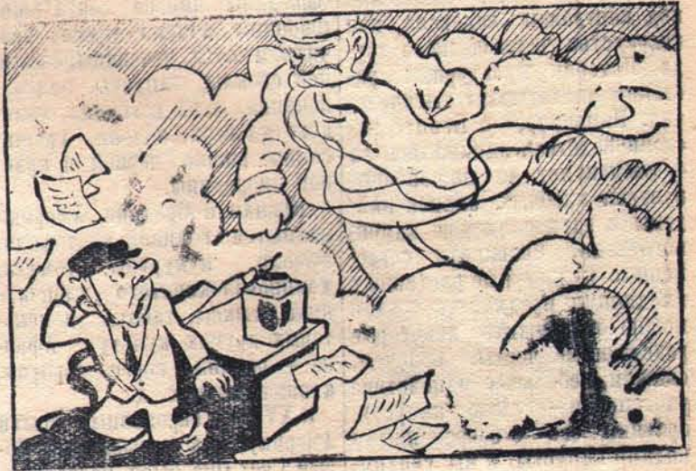
Каждый раз приходит не вовремя и без доклада!..