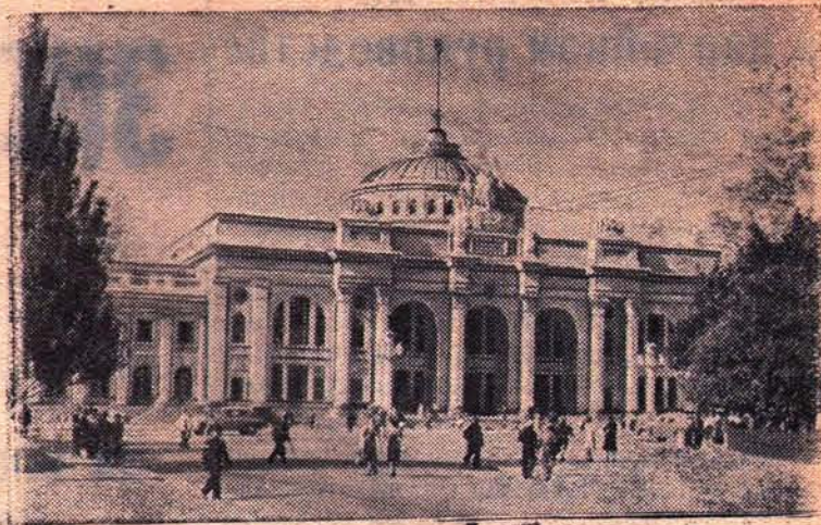
ОДЕССА. Железнодорожный вокзал.