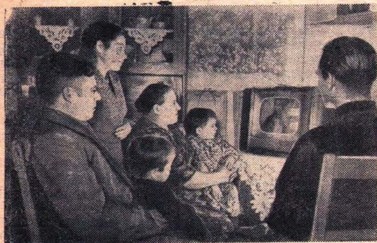
Новосибирская область. Колхоз имени Ленина, Новосибирского района, ежегодно получает миллионные доходы. В этом году, например, доход составит более трех миллионов рублей. Это позволило руководству колхоза

за вложить значительные средства в жилищное и хозяйственное строительство. В колхозном центре — селе Ленинском выросли новые благоустроенные жилые дома, строится Дом культуры со зрительным залом на 250 мест, на колхозные фермы и в дома колхозников проводится водопровод.