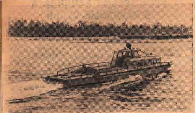
Ленинград. В Центральном научно-исследовательском институте лесосплава создано новое патрульное судно без винтов для обслуживания молевого сплава древесины на реках. Устройство его простое. В днище носовой части катера имеется отверстие, через которое вода всасывается во внутрь корпуса, а затем по боковым трубопроводам выбрасывается с большой силой через корму выше ватерлинии. Новое судно может проходить по самым мелководным рекам.