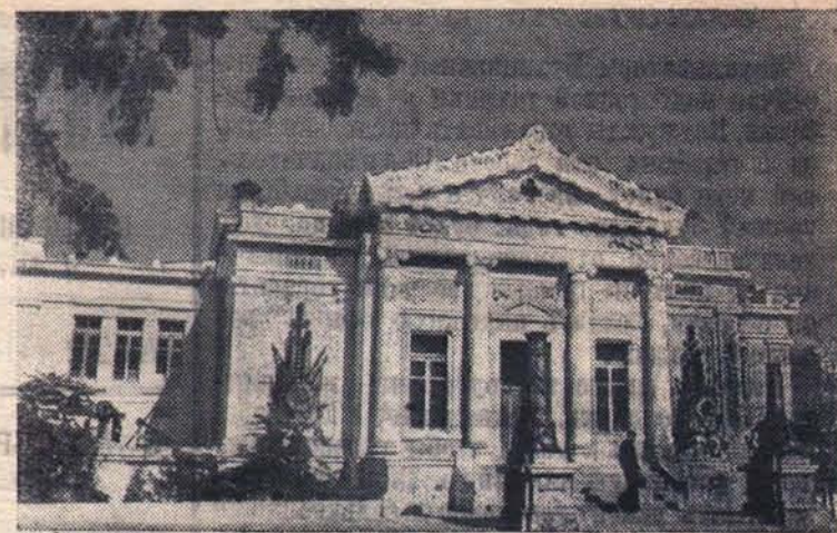
СЕВАСТОПОЛЬ. Музей Севастопольской обороны.

Например, 16 сентября текущего года после выдачи заработной платы в общежитиях строительно-монтажного по-