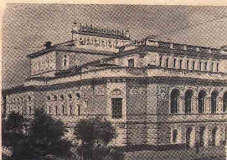
Горький. Театр драмы имени А. М. Горького на улице Свердлова.