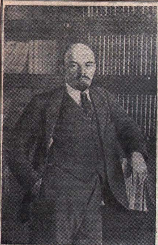
В. И. ЛЕНИН (1918 год.)

Да здравствует победоносное знамя современной эпохи, знамя всего прогрессивного человечества — марксизм-ленинизм!