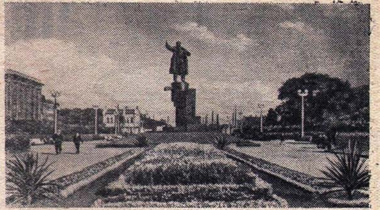
Ленинград. Площадь Ленина у Финляндского вокзала. В центре — памятник В. И. Ленину.