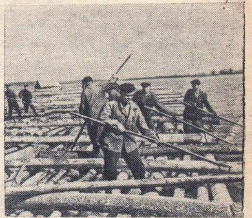
Чувашская АССР. Начался сплав леса на реках республики. По Волге и другим рекам лесопромыслов отправляют десятки тысяч кубометров леса. Оживленно в эти дни в Приволжском леспромысловом хозяйстве. Начался сплав Волги. Нужно успеть отправить лес, пользуясь высоким уровнем воды. Первые плоты уже отправлены в Куйбышев и другие города. Готовится большой плот для шахт Донбасса.

С каждым днем наращивать темпы сплавных работ!