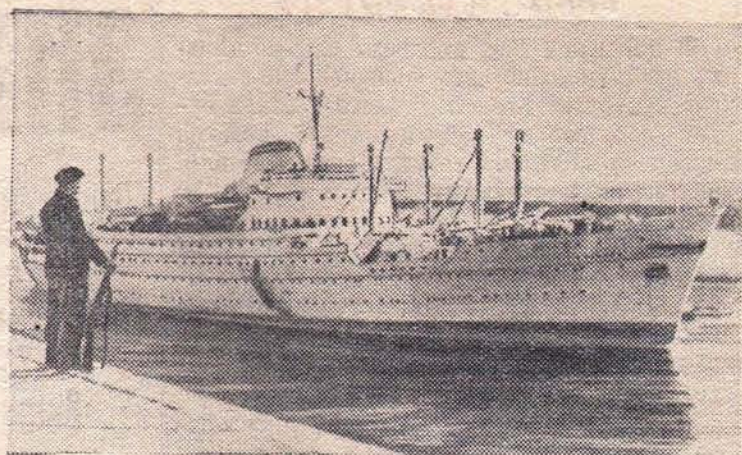
Египет. Судходное движение по Суэцкому каналу полностью восстановлено.

Бюро райкома КПСС и исполком аймсовета обязали секретарей парторганизаций колхозов широко обсудить настоящее постановление на открытых партсобраниях и принять конкретные мероприятия по выращиванию высокого урожая кукурузы в 1957 году.