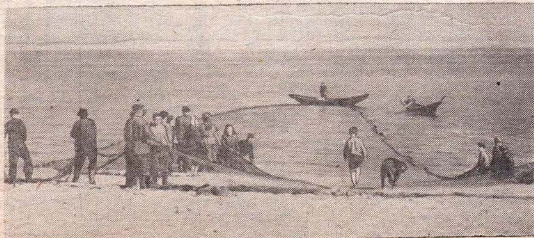
НА СНИМКЕ: Рыбаки и рыбацки молодежной бригады В. Г. Волкова заканчивают второе за день притонение. За вторую тонь они выловили и сдали 6 центнеров рыбы.