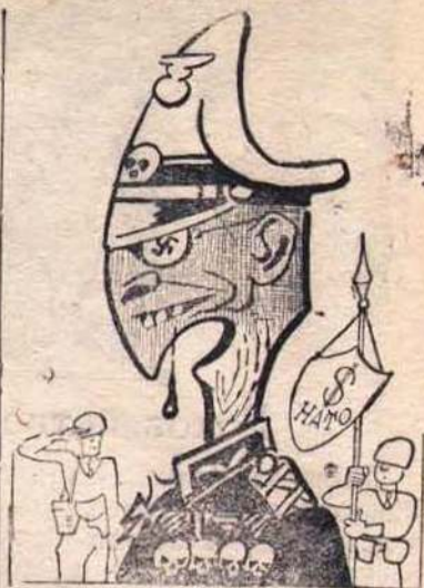
Лицо генерала Шпейделя

Пользуясь своей безнаказанностью, английские и американские военнослужащие, находящиеся в Западной Германии, продолжают совершать многочисленные преступления по отношению к немецкому населению. В районе Люнебурга (Нижняя Саксония) за последние четыре месяца было зарегистрировано свыше 50 таких преступлений.