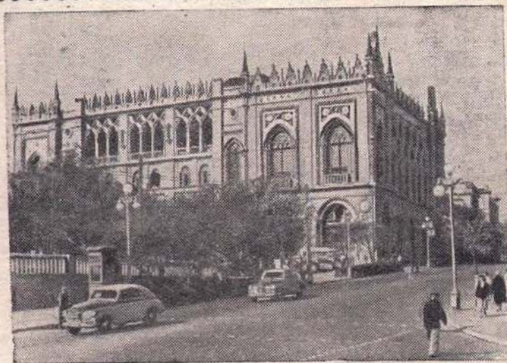
БАКУ. Здание Академии наук Азербайджанской ССР.

В нашей стране осуществлено всеобщее семилетнее обучение, а в настоящее время постепенно вводится обязательное среднее образование. Всеми видами обучения охвачено 50 миллионов человек; это означает, что каждый четвертый гражданин Советского Союза учится. До революции в России насчитывалось менее 200 тысяч специалистов с высшим и средним специальным образованием.