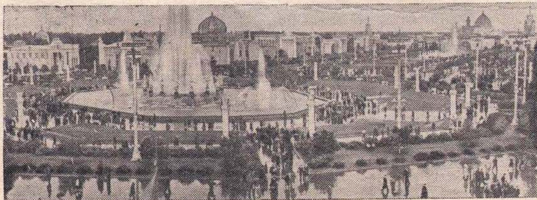
Москва. Всесоюзная сельскохозяйственная и промышленная выставки 1957 года. НА СНИМКЕ: общий вид выставок.

„ЗНАМЯ ПОБЕДЫ“ 2 августа 1957 г. стр. 3.