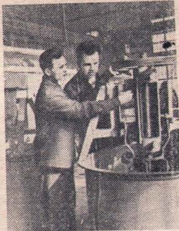
Иркутская область. Рядом с городом Усолье-Сибирское за послевоенные годы вырос крупный завод, изготовляющий обогащательное, шахтное и строительное оборудование для горной промышленности. Продукция предприятия отправляется на стройки Советского Союза и в страны народной демократии. Включившись в социальное соревнование за достойную встречу 40-й годовщины Великой Октябрьской Социалистической революции, коллектив досрочно выполнил полугодовой план и дал свыше полумиллиона рублей сверхплановой экономии.