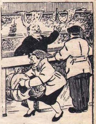
Лавочка из-под прилавочка.