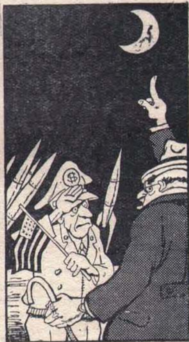
— Не забудьте объявить Луну нашим 49-м штатом.

«Американский журнал „Нешл сайэнс“ предлагает послать на Луну в ракете американский флаг и, таким образом, провозгласить ее американской территорией.» (Из газет)