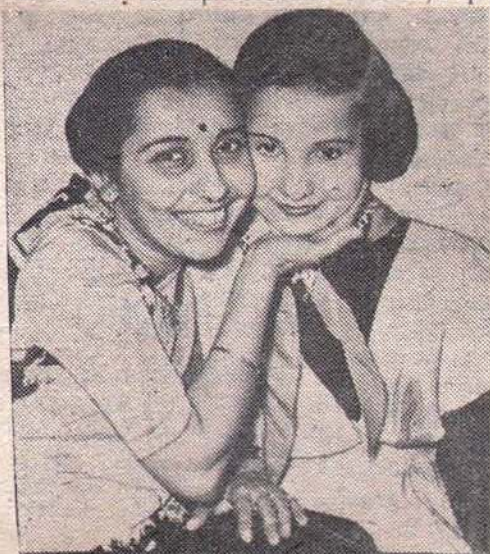
Вот она, дружба разных народов!

Эти волнующие встречи, встречи друзей, не забудутся никогда!