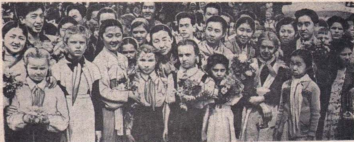
Зарубежные друзья среди пионеров.