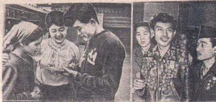
Они будут крепко дружить!

Благодаря бдительности сирийских патриотов американский заговор ликвидирован. Сирийское правительство еще раз провозгласило, что оно не свернет с пути национальной независимости. Однако США, по выражению арабской печати,