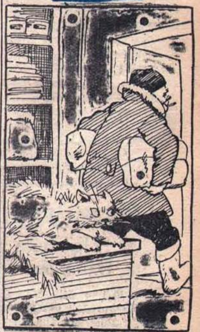
— Жаль, что наш завмаг не мышь: я бы его давно поймал.