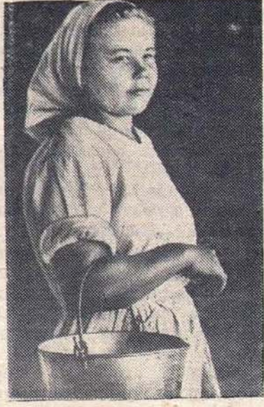
надоям молока. За 25 дней августа она надоила более 200 литров на каждую корову.