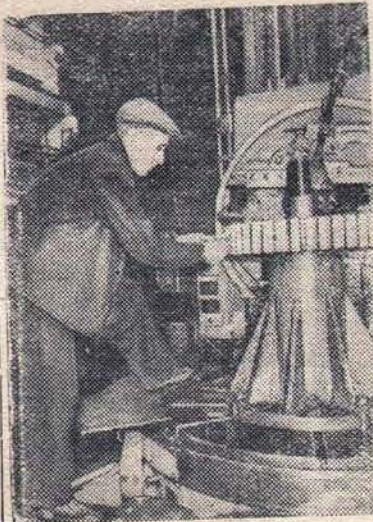
Рязань. Коллектив завода тяжелого кузнечно-прессового оборудования выполняет заказы для стран народной демократии.