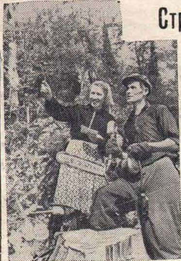
1. Башкирская АССР. Коллектив Яман-Елгинского леспромхоза, соревнуясь в честь 40-летия Великого Октября, план заготовки и вывозки леса выполнил на 102 процента.

Впереди идет комсомольско-молодежный мастерский участок