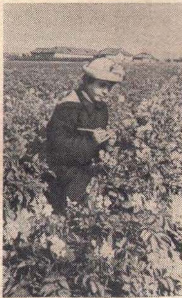
Салехард. На широте полярного круга расположена опытная сельскохозяйственная станция научно-исследовательского института сельского хозяйства Крайнего Севера. Здесь применительно к условиям северного климата разрабатываются новые сорта растений, разрабатывается агротехника выращивания их.

№ 80(1068) | Среда, 4 сентября 1957 г. | Цена 15 к.