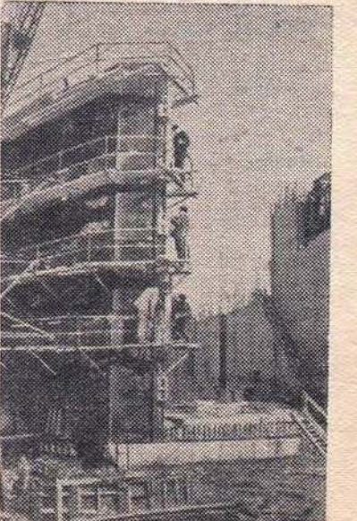
На снимке: общий вид второй камеры шлюза Новосибирской ГЭС.