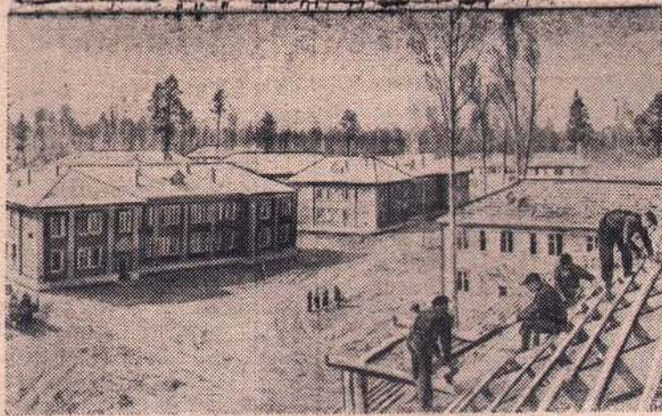
Красноярский край. Еще год назад здесь была тайга, а теперь широко раскинулся и продолжает быстро расти поселок Ново-Енисейск, где сооружается большой лесной комбинат.