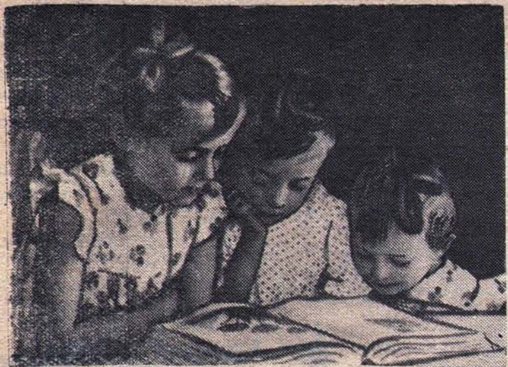
До чего же интересная книга!