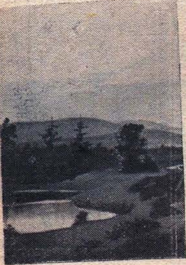
Река Таланчанка при впадении в Байкал.