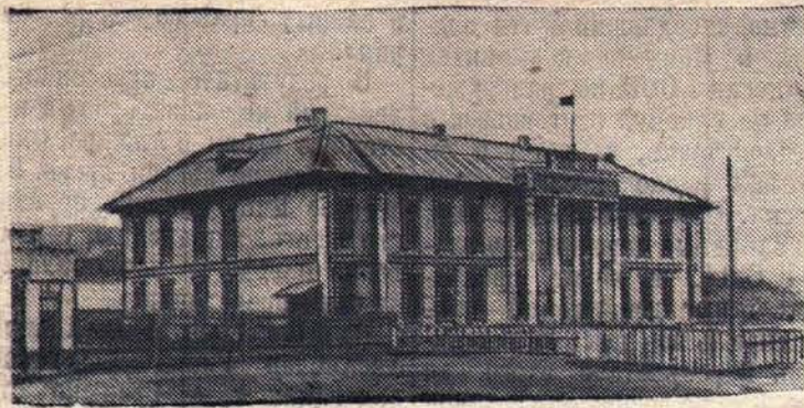
Это — здание Ильинской средней школы. Здесь получают образование дети ильинских трудящихся.