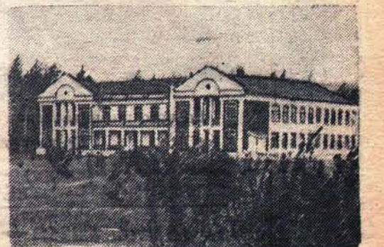
В живописном месте находится Ильинский детский тубсанаторий.