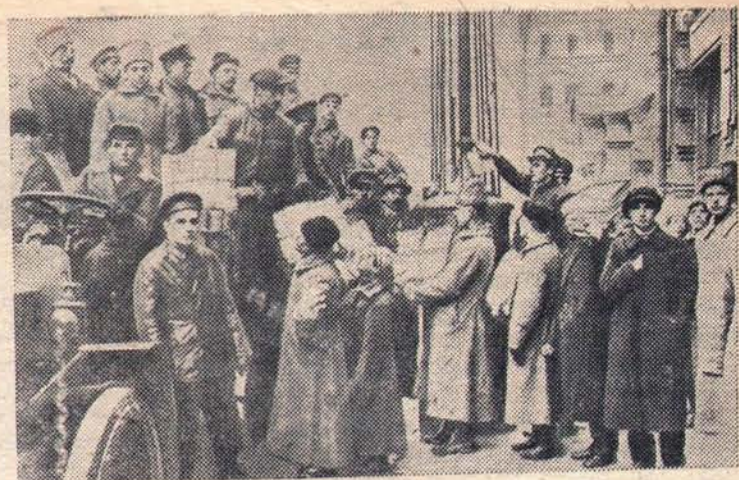
Раздача газет в первый день заседания Советов в гор. Москве. 1917 год.