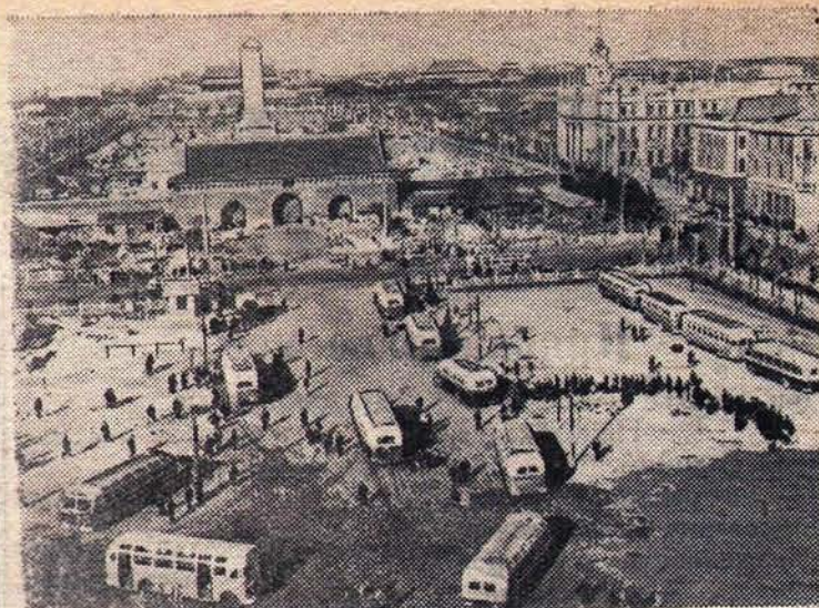
НА СНИМКЕ: автобусная станция в центре Пекина.

Культурные растения, созданные человеком, явились высшей ступенью в развитии растительного мира. Сейчас насчитывается примерно 1.500 видов культурных растений, причем все они почти относятся к цветковым растениям.