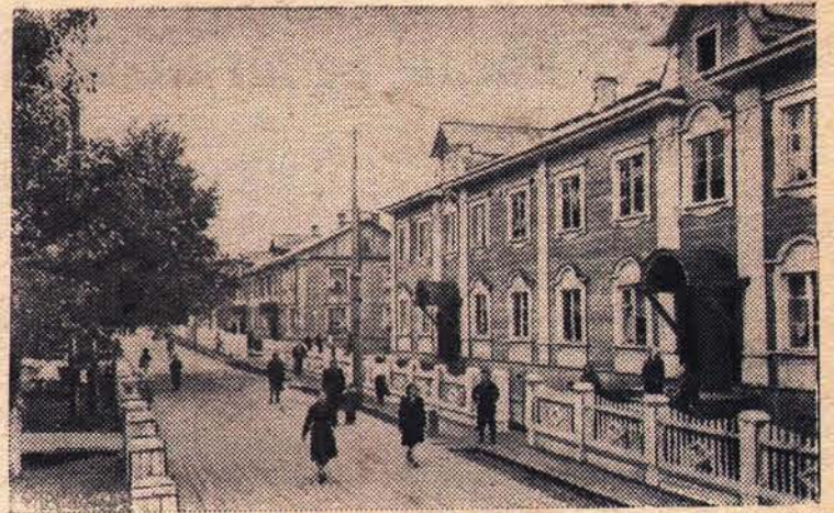
В Архангельске вступает в строй новое высокомеханизированное предприятие — лесозавод № 12 Управления бумажной и деревообрабатывающей промышленности Архангельского экономического административного района. Завод оборудован новейшей техникой лесопиления. Вместе с заводом растет заводской поселок.

секретарь комитета комсомольской организации леспромхоза.