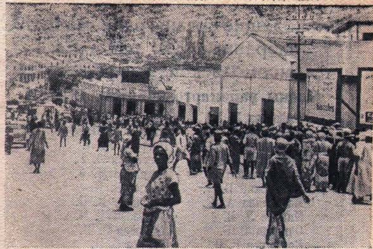
Гана (Золотой берег). Центральный рынок в городе Кумаси.