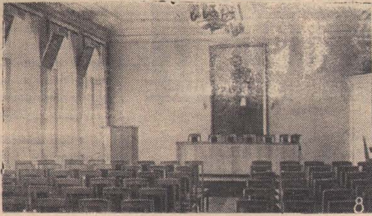
Ульяновск. Актовый зал бывшей Симбирской мужской классической гимназии, где В. И. Ленин в 1887 году сдавал экзамен на аттестат зрелости. Самый молодой в классе, он отлично сдал экзамен и единственный из всех получил золотую медаль. В настоящее время в этом здании помещается средняя школа № 1 имени В. И. Ленина.

ПО ДАННЫМ ЮНЕСКО, произведения В.И. Ленина занимают первое место в мире по количеству переводов.