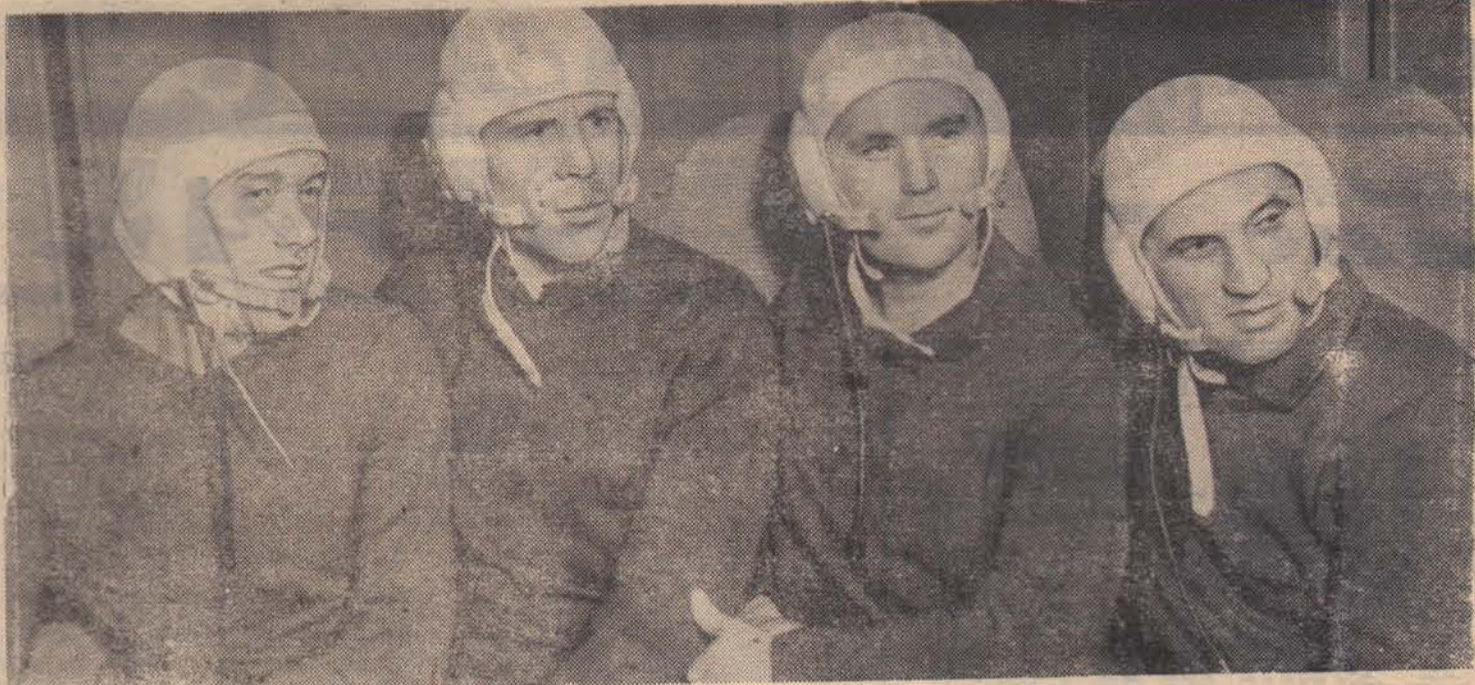
Летчики-космонавты (слева направо): член экипажа космического корабля «Союз-5» борт-инженер Алексей Станиславович ЕЛИСЕЕВ, член экипажа корабля Союз-5 инженер-исследователь Евгений Васильевич ХРУНОВ, командир корабля «Союз-4» Владимир Александрович ШАТАЛОВ, командир корабля «Союз-5» Борис Валентинович ВОЛЫНОВ.