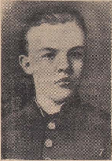
В. И. Ленин после окончания гимназии. Симбирск. Фото 1887 г.