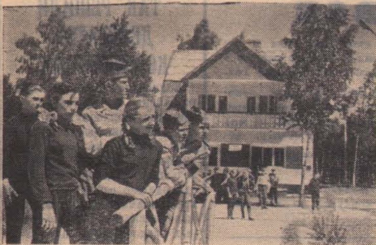
ВОЛЫНСКАЯ ОБЛАСТЬ. В Цуманском лесу, где в годы Великой Отечественной войны стояло партизанское соединение Героя Советского Союза Д. М. Медведева, открыт музей партизанской славы. Его многочисленные экспонаты и документы рассказывают посетителям о славных делах народных мстителей, о жизни и боевом подвиге партизана-разведчика Героя Советского Союза Н. И. Кузнецова.