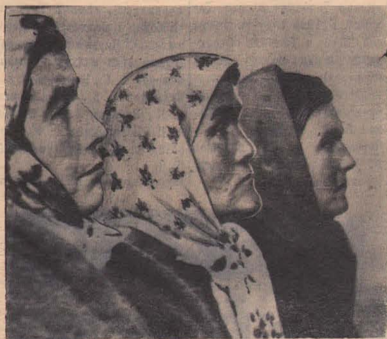
Эти женщины немало потрудились и перенесли, чтобы колхозы добились нынешнего расцвета. Но и сегодня они активно участвуют в колхозной жизни.

250732 рубля. Оплата труда не превышала 8—12 копеек, 1,5—2 кг хлеба на трудодень. Например, было выдано на трудодень в 1940 году в колхозе «Новый Путь» (Югово-Таловка) — 10,5 копеек, 1 кг хлеба, в колхозе им. Сталина (с. Кома) — 7,5 копеек, 2 кг 300 граммов хлеба, в колхозе им. Молотова (с. Нестерово) — 11,5 копеек, 1 кг 440 граммов. В настоящее время в результате объединения и реорганизации некоторых колхозов в районе осталось три сельхозартели. Эти колхозы объединяют 1148 дворов с 1289 трудоспособными.