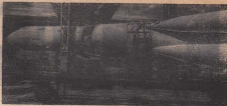
На таком корабле впервые в мире шмурмовал космос Юрий Гагарин. НА СНИМКЕ: копия космической ракеты с кораблем „Восток“ перед установкой на ВДНХ.

№ 122 (2489) ● ВТОРНИК, 14 ОКТЯБРЯ 1969 г. ● ГОД ИЗДАНИЯ 6-й ● Цена 2 коп.