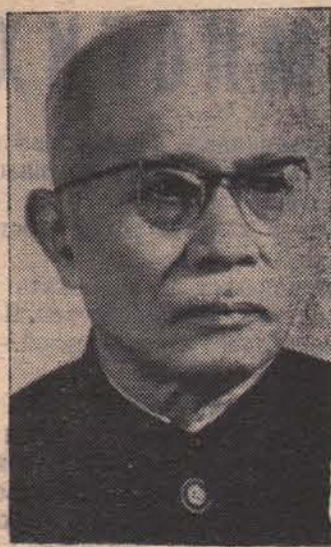
Президент Демократической Республики Вьетнам Тон Дык Тханг.