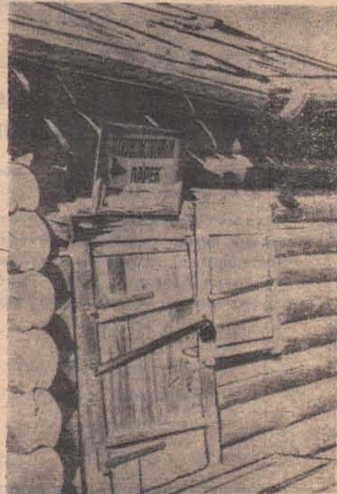
Рисунок худ. М. АЛЕКСЕЕВА.

ступают руководители Селенгинской лесобазы, межколхозной строительной организации и ремонтно-строительного участка.