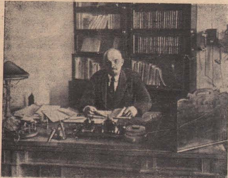
НА СНИМКАХ: В. И. Ленин в своем кабинете в Кремле 16 октября 1918 года.