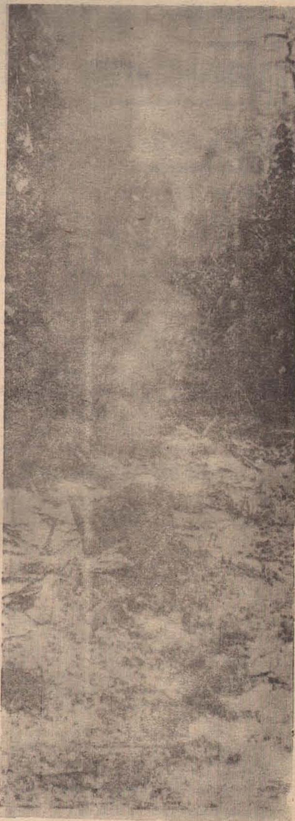
Речка в тумане дымится Уснула под снегом тайга...