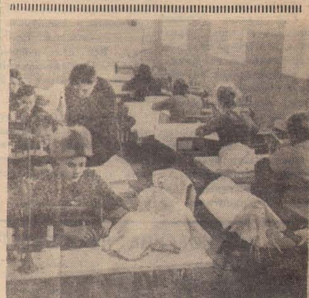
Московская область. В совхозе «Заря коммунизма» работает цех по пошиву спецодежды (на снимке). Здесь шьют халаты, куртки, комбинезоны, рукавицы, фартуки.