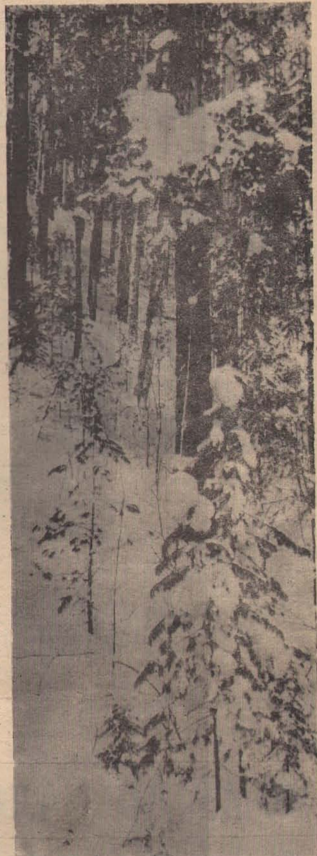
Склоны прибрежных гор покрыты густыми зарослями сосны, ели и кедров. И трудно поверить, что от руки человека Байкал может лишиться своего зеленого ожерелья.